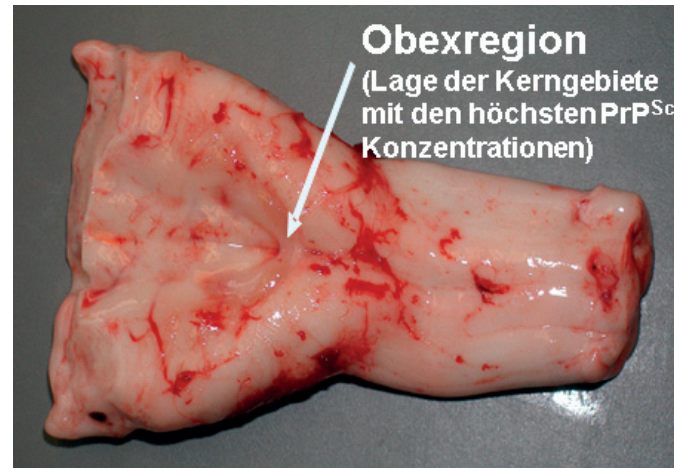
Entnommene Stammhirnprobe eines Rindes

Für die amtliche TSE-Untersuchung darf nur Material aus der Obexregion von Stammhirnproben, bei Schafen zusätzlich Kleinhirnantteile, verwendet werden.