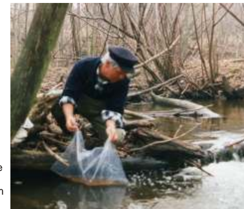
Besatzmaßnahme mit Meerforellenbrütlingen in einem Fließgewässer

Neben dem fischereirechtlichen Schutz durch Schonzeiten, Mindestmaße und Schutzgebiete, führen die Fischereiverbände, die Binnenfischer und auch die obere Fischereibehörde regelmäßig Besatzmaßnahmen zur Erhaltung, Bestandsstützung und zum Wiederaufbau gefährdeter oder stark genutzter Fischbestände durch.